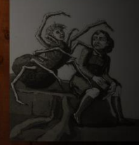
LADY BIRD, LADY BIRD PAULA REGO